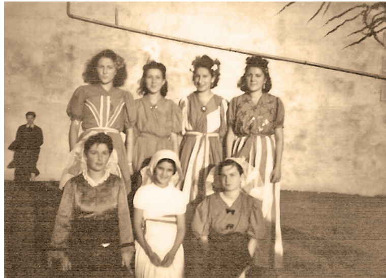
• Saint-Junien, mai 1945.

La victoire de 1945, après cinq années de souffrance, a provoqué en France une immense vague de joie. A partir du 8 mai, manifestations populaires spontanées et cérémonies officielles se succèdent dans toutes les villes. Partout, les discours célèbrent les vainqueurs, les héros et les martyrs.