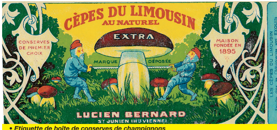
• Etiquette de boîte de conserves de champignons