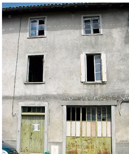
Ancien atelier de mécanique Boutin, rue Defaye (2013).

La quasi-totalité des morts pour la France du monument de la collégiale de Saint-Junien sont des membres de l'infanterie