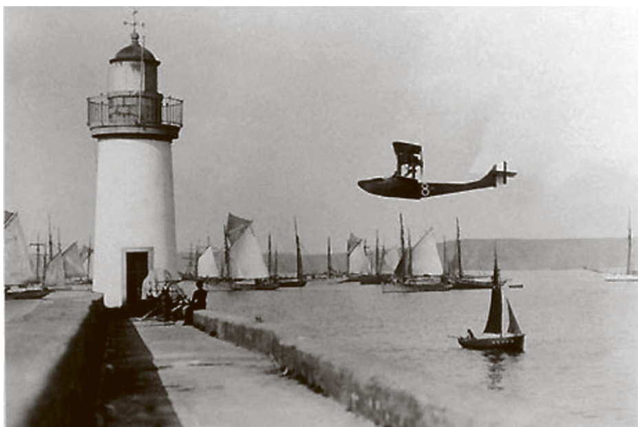
Amerrissage d'un hydravion Donnet-Denhaut 150 CV dans le port de Camaret. (Photo Archives Jules Pouyer).