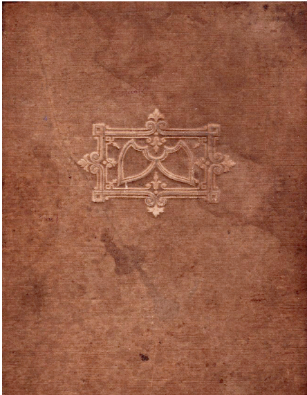
Couverture de cahier.

A VEC pour titre illustré en couleurs Chansons P. Coindeau Saint-Junien (Hte-Vienne) , c'est un peu de l'ambiance à la fois tendre ou émouvante des premières années du XX e siècle qui se présente à nous sous l'aspect d'un cahier relié en carton toilé, (17 cm x 22,5 cm ; 164 p.), bistre avec un décor en relief, façonné par repoussage. Une table des matières fait état de 64 titres avec renvoi aux pages.