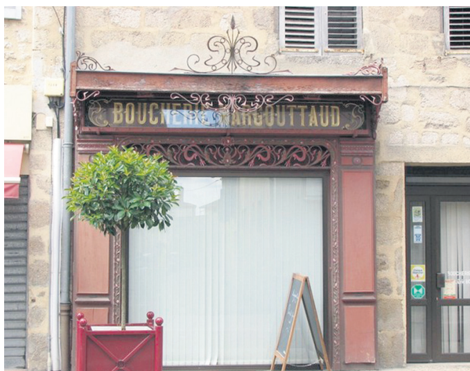
Devanture de l'ancienne boucherie Margoutaud, rue Lucien-Dumas.