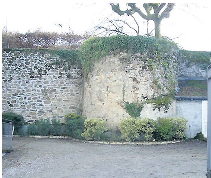
La tour de Beuil, boulevard de la République.