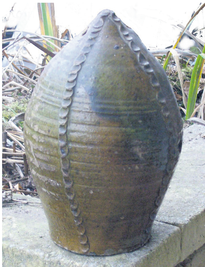
Vase découvert à Saint-Amand en 1898.

C'EST une poterie en terre vernissée, dont la forme s'apparente à celle d'une ogive, mesurant 27 cm de hauteur, pour 12 cm de diamètre au pied et 18 cm au milieu de la panse. Son décor est composé de trois cordons verticaux imprimés avec le doigt et sa couleur varie de l'ocre au vert (voir photo). L'objet ne comporte qu'une seule ouverture, curieusement située à mi-hauteur, autour de laquelle on distingue la trace d'un arrachement circulaire. Enfin, deux brisures sont visibles, l'une au pied l'autre près du sommet, comme les attaches d'une anse cassée, tandis qu'un trou dans la partie supérieure correspond à un percement ultérieur.