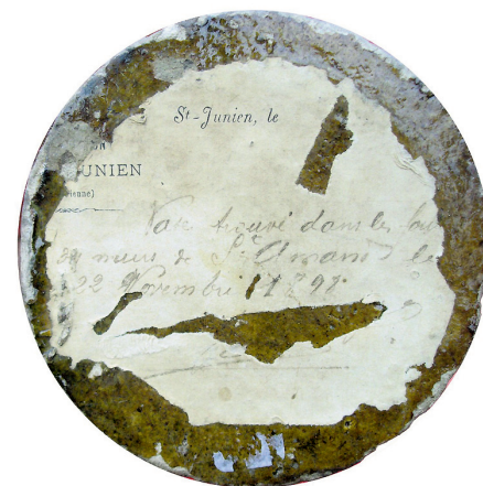
Étiquette manuscrite collée sur le fond du vase.

Sous le pied a été collée une étiquette manuscrite, malheureusement bien abîmée, avec ces quelques mots : Vase trouvé dans les fouilles des murs de Saint-Amand le 22 novembre 1898. Les arrachements du papier ont fait disparaître la signature, de même que la plus grande partie d'un en-tête imprimé car l'étiquette a été découpée dans une page de correspondance d'entreprise de Saint-Junien.